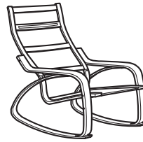
Schaukelstuhl Rahmen erhältlich in Birke, Schwarzbraun, Eichenfurnier weiss lasiert.