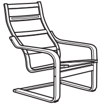
Sessel Rahmen erhältlich in Birke, Schwarzbraun, Eichenfurnier weiss lasiert.

Die Rahmen sind in verschiedenen Holzarten und mit verschiedenen Lackierungen erhältlich.