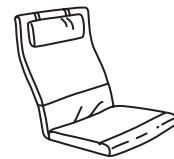
Kissendesign mit «Vislanda» Stoffbezügen.

3. Kombiniere ihn mit einem Hocker. Wähle einen Hocker in einem Material und mit einem Kissen, die perfekt zu deinem neuen Sessel passen.